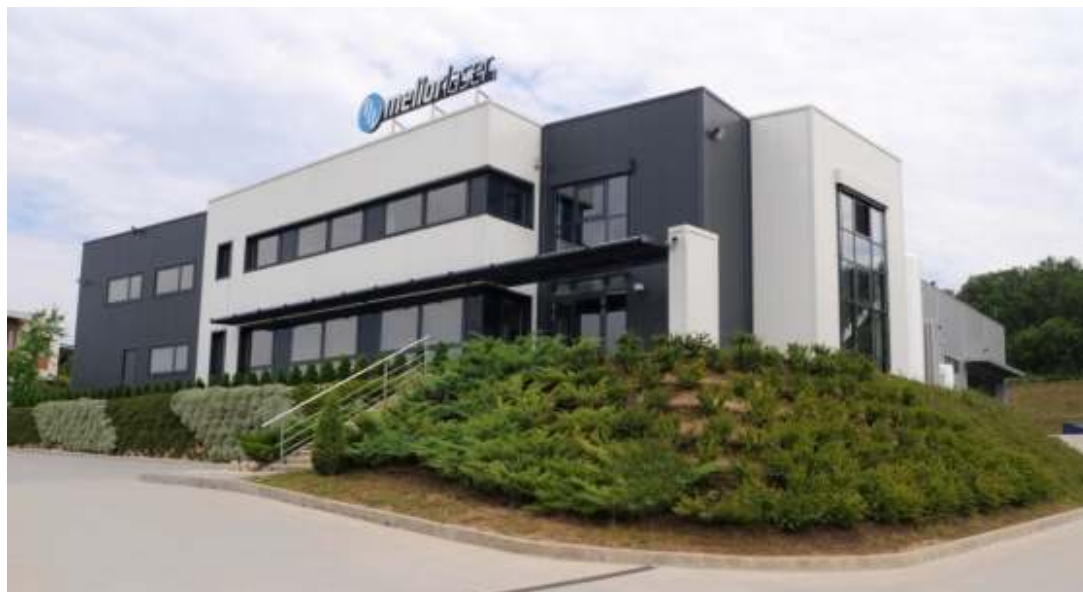
A tudatos minőség szemlélet minden területen jelen van

A Melior Laser Kft. által alkalmazott technológia igen szerteágazó szolgáltatási palettát kínál, ugyanakkor a lézervágás, stancolás, élhajlítás, kötőelem-sajtolás, hegesztés, csiszolás, felületkezelés munkafolyamatok során számos hiba adódhat, ráadásul megannyi oka lehet a hibás termék keletkezésének. A cég az elvárt és a kívánalmak szerint egyre javuló eredményességi mutatókat szem előtt tartva váltott, és a minőség tökéletesítése érdekében minőségközpontú gondolkodásba, a minőség szemlélet cégen belüli tudatos meghonosításába kezdett. A kiváló minőség elérése érdekében elengedhetetlen a minőségügyi szervezet működtetése, a minőségbiztosítással, tervezéssel, szabályozási elemekkel ellátott minőségirányítási rendszer bevezetése.